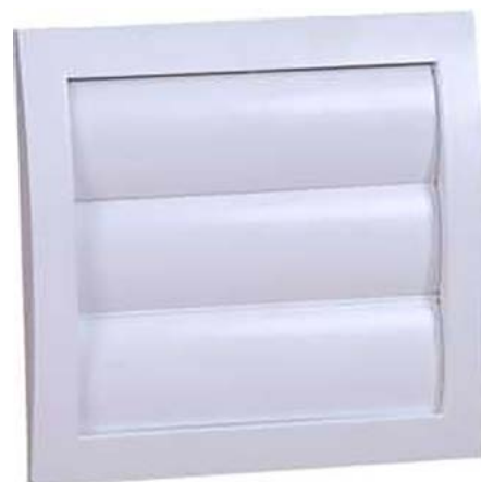
ND10Z; ND12Z; ND15Z