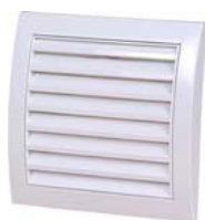
ND 10; ND 12; ND 15