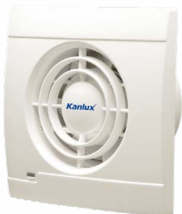
VULKAN VK100L; VULKAN VK100T

A golyóscsapágyas ventilátorok fehér színű műanyagból készülnek.